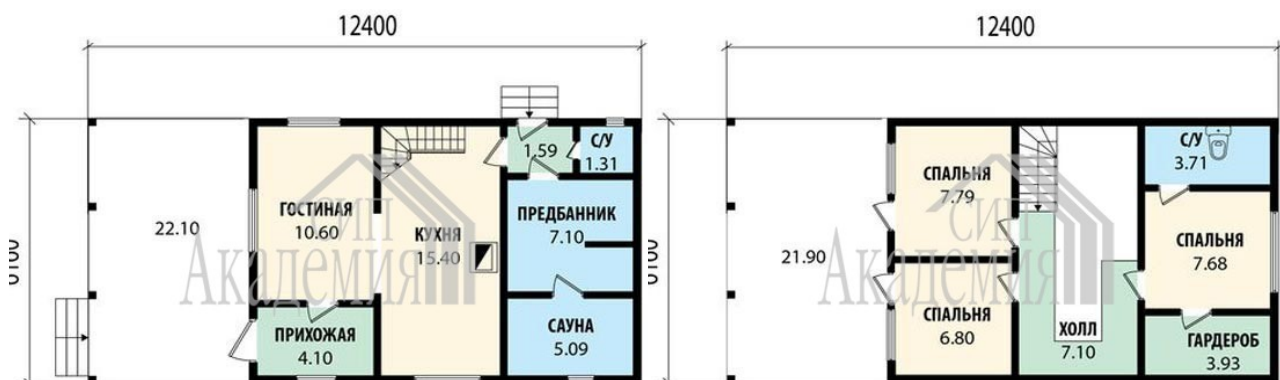
План второго этажа